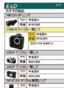
※検索条件設定画面、検索結果一覧画面用の Flash も自動的に生成可能です。

貴社システムへの K-Fla システム組み込みだけでなく、その他カスタムメイドのシステムの構築・運用にも多数の実績がありますので、ご相談ください。